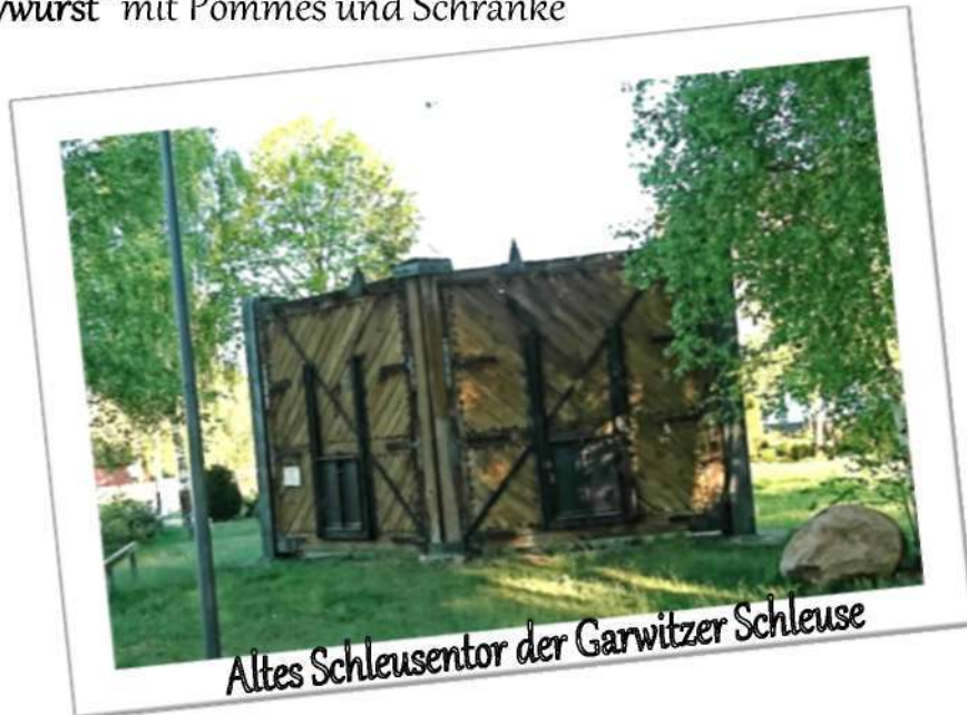
Altes Schleusentor der Garwitzer Schleuse

„Currywurst“ mit Pommes und Schranke 5,90 €